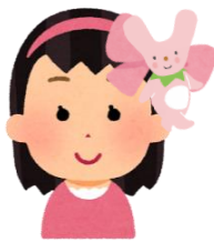
(例) カーミンのカチューシャ