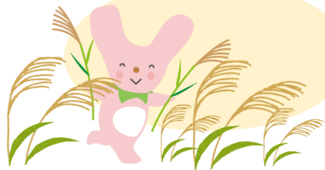
(例) 砥峰高原のススキを見に行くカーミン